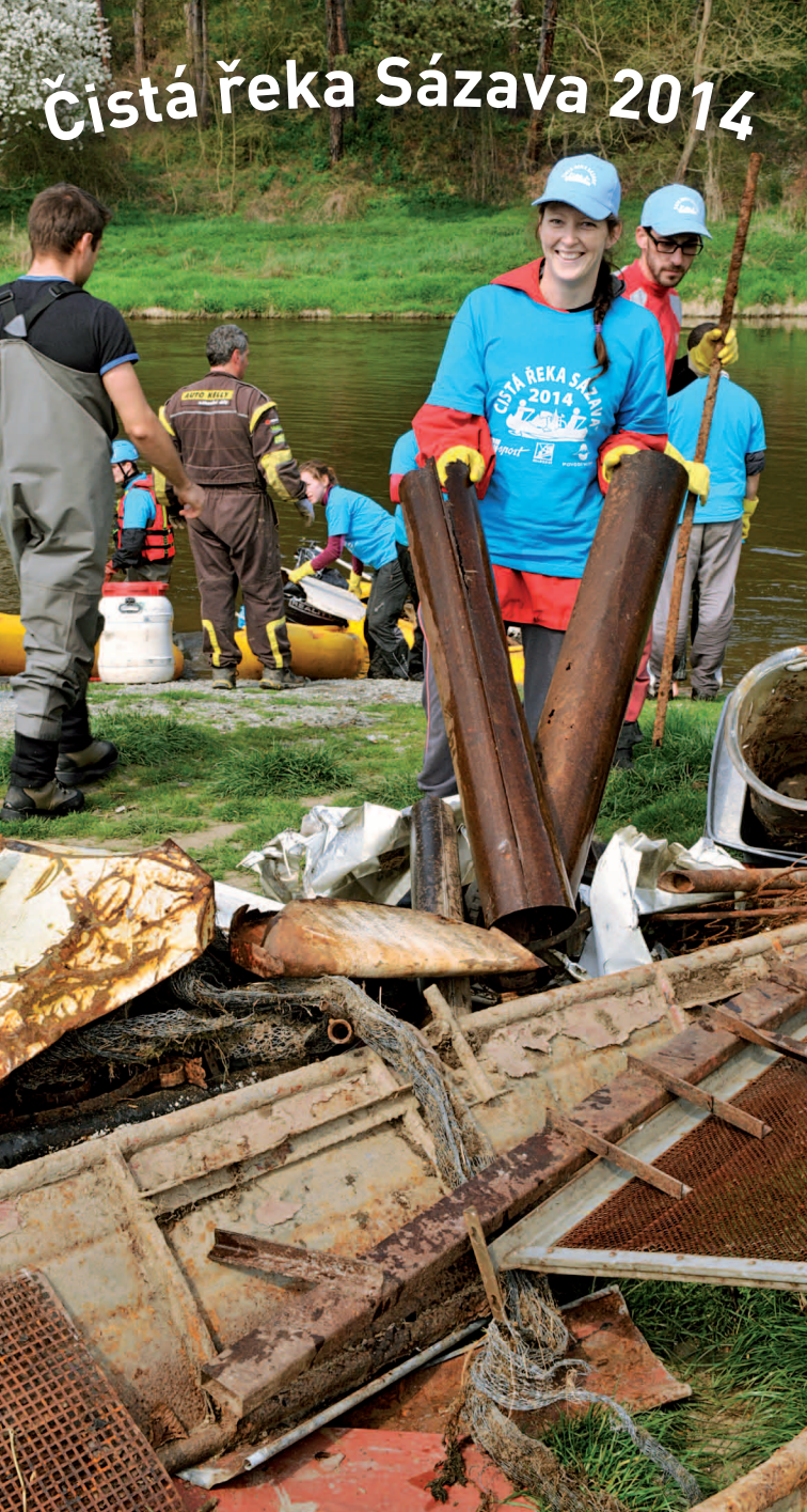
Grafická úprava a tisk: Pavel Fuksa – GraTypoPrint Vydala společnost Posázaví o.p.s., v roce 2014 v nákladu 5 000 ks NEPRODEJNÉ

Projekt je čistě nekomerční aktivitou, která je financovaná z dotací od obcí, z příspěvků sponzorů a dalších dárců.